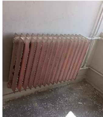
Isıtma sistemi (Sık sık arızalanıyor)