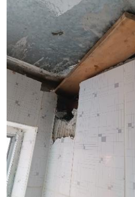
Tuvalet iç duvarı (Kısmen çökmüş)