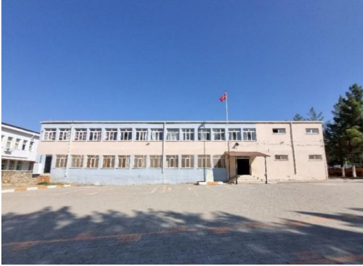
Okul binasının önü