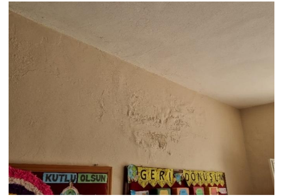
İç duvar (çatlaklar ve deformasyon)